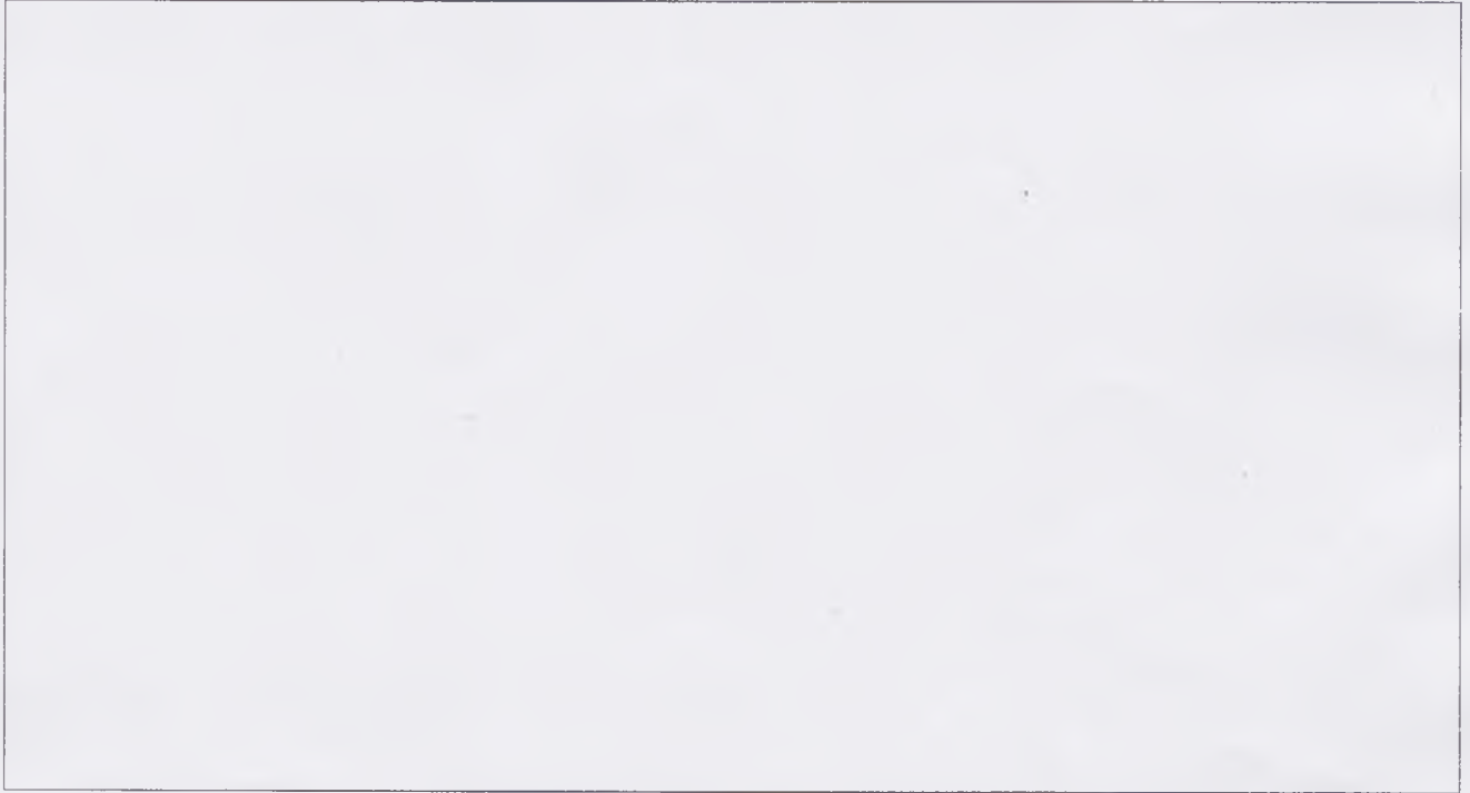
ФОТО МІСЦЯ РОЗТАШУВАННЯ ПОКАЖЧИКА